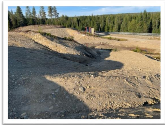
Bilde: S-sving /BOB-bane

Se ytterligere beskrivelse i linken nedenfor: