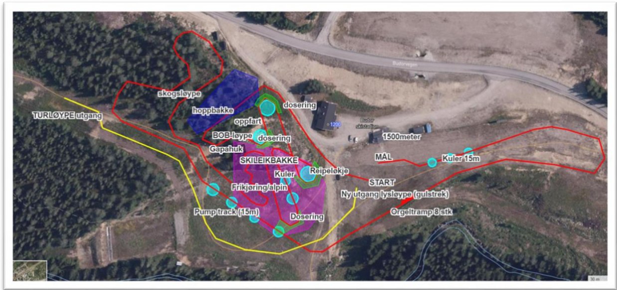
Bilde: Ideskisse helårsanlegg med aktiviteter sommer og vinter