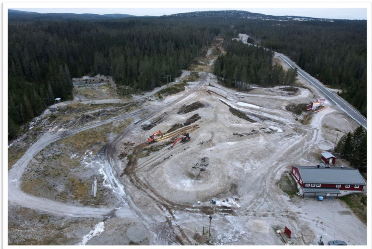
Bilde: Budor aktivitetspark: Ferdig modellert med anleggsmaskin