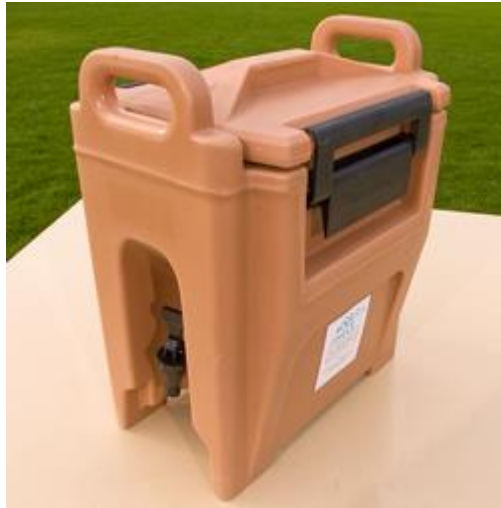
Thermo drikkecontainer à 11 liter