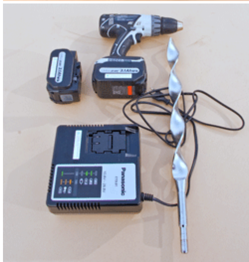
Drill med isbor ø 32 mm.