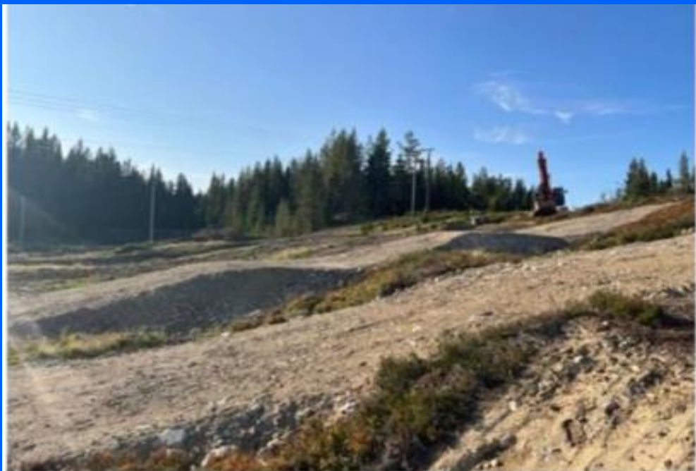
Bilde: Stor kuleløype