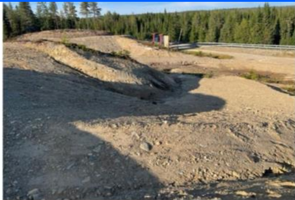
Bilde: S-sving /BOB-bane