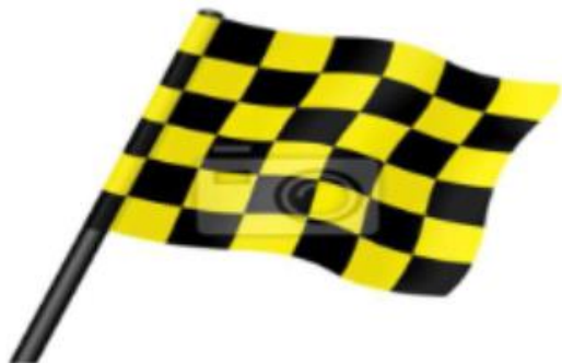
Figur 1: Farlige elementer eller objekter i løypen merkes med gult og sort-rutet flagg.

Objekter eller farlige elementer i nedkjøringen, slik som steiner som er vanskelig å se, partier med bar bakke eller andre hindringer i løypen skal merkes med gult og sort rutete flagg (Figur 1).