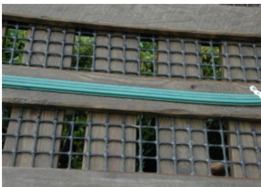
K8 bakken i Brattåsen

Sporene i bakken er laget av armeringsplast. . Dette fungerer aldeles utmerket. I Gjerpenkollen har dette vært brukt i over 10 år i heisen uten at det har vært byttet ut.